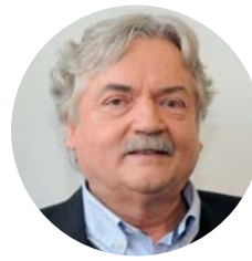
REDAKTION WILFRIED BOMMERT

Sozialwissenschaftlerin, Fachexpertin für Ernährungssouveränität, Bochum